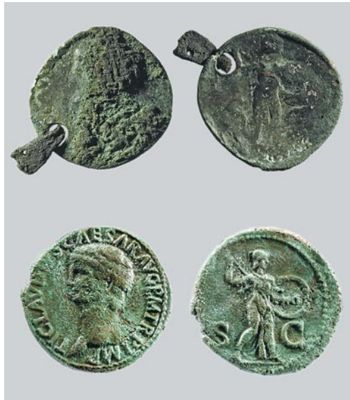
Abb. 296: Langenthal, Unterhard. Grab 64. Oben: Münze (Nr. 7) des Claudius mit Minerva Promachos auf der Rückseite. Die nach rechts schreitende Göttin ist mit Rundschild und Speer bewaffnet und trägt die unheilabwehrende Ägis, einen geschuppten und von Schlangen umgebenen Brustschutz, dessen Mitte ein Gorgonenhaupt ziert. Unten: Vergleichsbeispiel aus Avenches, En Chaplix VD, Canal (AV90/7831-62). M. 1:1.