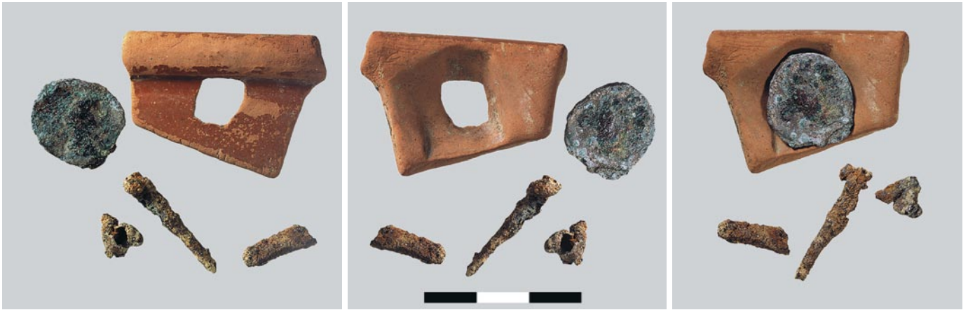
Abb. 294: Langenthal, Unterhard. Grab 56 (610–630/640). Der in die rechteckige Vertiefung einer Terra-sigillata-Scherbe eingelassene Antoninianus des Gallienus(?) (260–268) Nr. 4 war mit drei Eisennägeln wahrscheinlich auf organischem Material befestigt, vielleicht auf einer Gürteltasche oder an einem Lederriemen. Das eigenartige Ensemble hat den Charakter eines Amuletts, steht bisher jedoch ohne Vergleich da. M. 1:1.

legung, Grab 110, bezeugt. Der Bestattete trug auf der linken Körperseite in einer Gürteltasche neben anderen Gegenständen (zwei Bronzenadeln, Silex, Bronzeahle, Eisennägel/-nadeln und Bronzedraht) auch zwei Münzen (Nr. 2–3; Abb. 305,2–3). 733 Die eine stammt von Domitian(?) und befand sich in der Tasche (Nr. 2); die andere wurde wohl in der frühen Regierungszeit Hadrians geprägt und haftete durch Korrosion am Taschenbügel (Nr. 3) (Abb. 154; 293). Dieses Stück ist gelocht und wurde somit als Schmuckanhänger zugerichtet. Da die Münze bei der Auffindung aber von Leder bedeckt war, dürfte sie ebenfalls einen Teil des Tascheninhalts gebildet haben. 734 Beide Exemplare gehören zusammen mit den übrigen Objekten somit zur Kategorie des Altmetalls, 735 das der Besitzer wegen des Metallwertes, vielleicht aber auch zur weiteren Verwendung bei sich getragen haben mochte. Im Falle der gelochten Münze kommt (zusätzlich?) die Funktion als Amulett in Frage. 736 Eine analoge Situation, das heisst