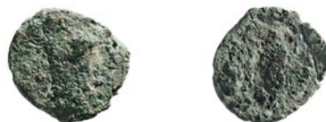
Abb. 305: Langenthal, Unterhard. Schicht 2 (Münze Nr. 1); Grab 110 (Münzen Nr. 2 und 3); Grab 64 (Münze Nr. 4).

Fnr. 71657.1 ADB Inv. Nr. 021.0001 SFI 329-5.1: 1